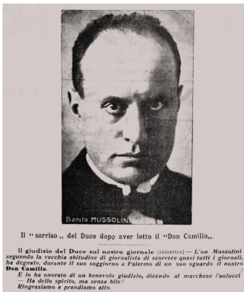
43. Il “sorriso” del Duce dopo aver letto il Don Camillo . Da Don Camillo , maggio 1924.

chiusura, perché, di fronte alle tragedie della dittatura, Don Camillo decise che non era più il caso di scherzarci sopra, e con un editoriale di fuoco, come vedremo, descrisse la vera natura del regime, e di che lacrime grondasse e di che sangue.