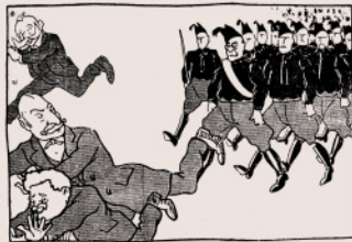
O Roma o Morte!

La carica dei fascisti a Roma. (L'ARMANDO TESTA)