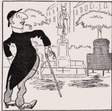
Di Scalea — Ci vuole un bel coraggio a mettere qui le vespasiane... Ma questo Sindaco che fa? Dorme?

44. «Il sindaco Lanza di Scalea: “Ci vuole un bel coraggio a mettere qui le vespasiane... Ma questo sindaco che fa? Dorme?”». Da Don Camillo , 1 marzo 1923.