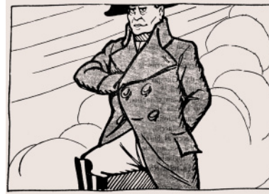
Fu vera gloria!

46. Terzo tempo, profetico: la dittatura. «Fu vera gloria!». Da Don Camillo , 25 ottobre 1923.